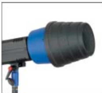
ТУБУС + СОТЫ